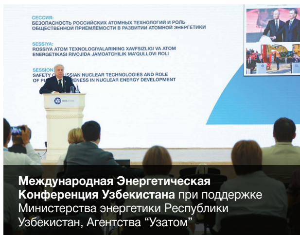
Международная Энергетическая Конференция Узбекистана при поддержке Министерства энергетики Республики Узбекистан, Агентства "Узатом"